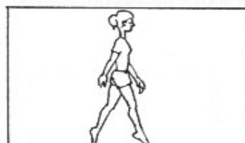
9. Tågång. 3x10 m.