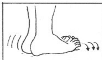
10. Dra sig fram med tårna. 3x20 st.