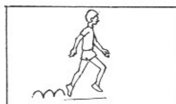
12. Hoppsa med vristfrånskjut. 3x20 m.