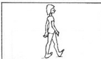
8. Hälgång. 3x10 m.