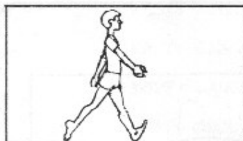
7. Gå och rulla på foten. 3x20 m.